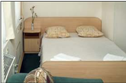
Kahyt på skibet

7:15 Morgenmad ombord 10:00 Peterhof (Nedre Park) 13:30 Retur om bord 13:30 Frokost ombord 14:30 Valgfri tur (overførsel til centrum (fritid)) 18:30 Middag ombord 19:00 Fritid 22:30 Dans