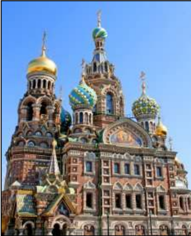
Saint-Petersburg, dag 11

12:30 Tilbage til skibet 12:30 til 13:45 Frokost om bord 14:00 Eremitage musset 18:30 Tilbage til skibet 18:30-20.00 Middag ombord 23:30 Valgfri udflugt (St. Petersburg om natten) 02:30 Retur ombord 22:30 Dans for dem som blive i skibet